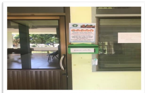
3. ห้อง PCU