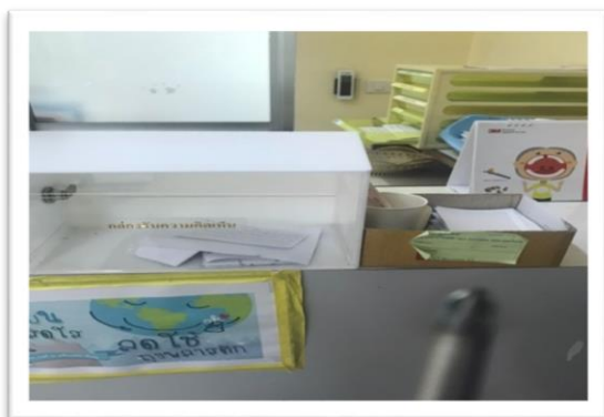
2.ห้องทันกรรม