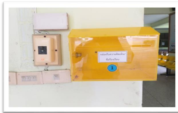
1.ด้านหน้า OPD